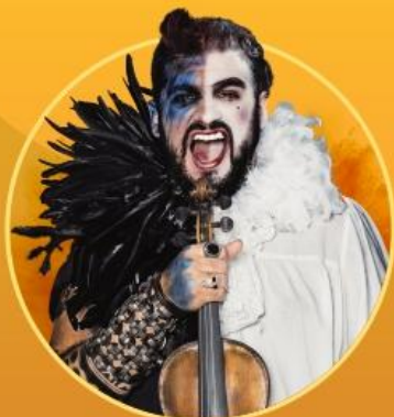
STRAD EL VIOLINISTA REBELDE