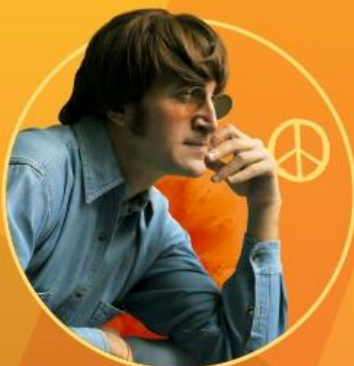
IMAGINE THE REVOLUTION Concierto Lennon & Los Beatles