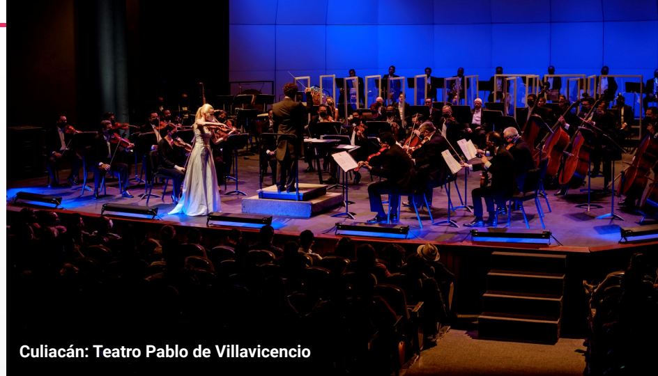
Culiacán: Teatro Pablo de Villavicencio