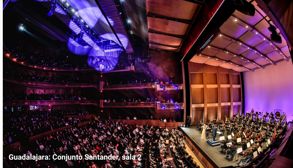
Guadalajara: Conjunto Santander, sala 2